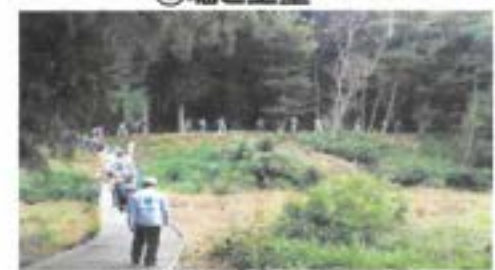
④阿弥陀寺側コース入口