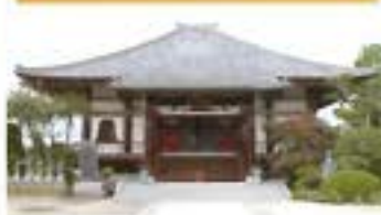
引接寺 いんじょうじ 浄土宗