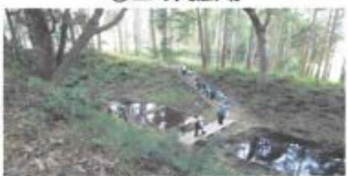
⑧本丸から二の丸へ