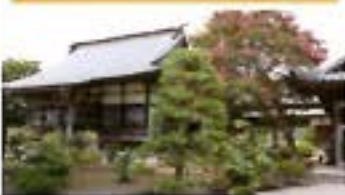
毘盧遮那寺 ひろくそ 真言宗豊山派