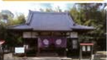
光照寺 こうしょうじ 真宗大谷派