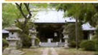
鱗勝院 りんしょういん 曹洞宗