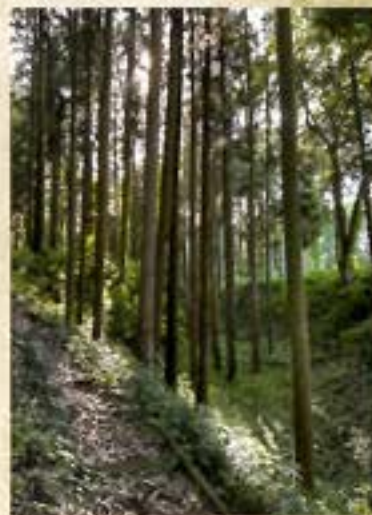
額田城跡 (那珂市指定文化財)