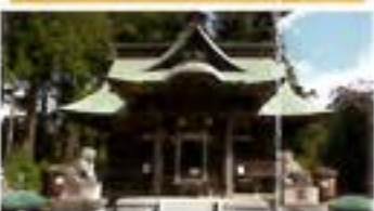
鹿嶋八幡神社(額田神社) かしまはちまんじんじや(ぬかだじんじや)