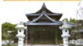
阿弥陀寺 あみだじ 真宗大谷派