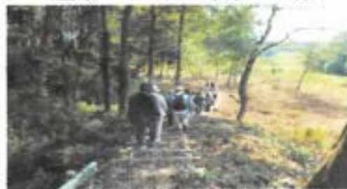
⑥南側から(田圃)本丸へ