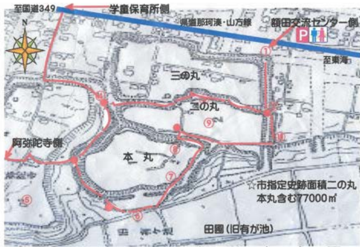
額田城跡遊歩道案内図

☆城跡には杉の木立や桜、ヤブツバキ、カシ、竹林その他約200種類の植物が見られます。整備された城跡内は、大人から子供まで散策できる遊歩道が設けられています。距離約3km、時間にして約40分で周回できます。下図はコースの一例です。(トイレは交流センターと阿弥陀寺にあります)