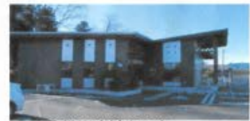
①額田交流センター